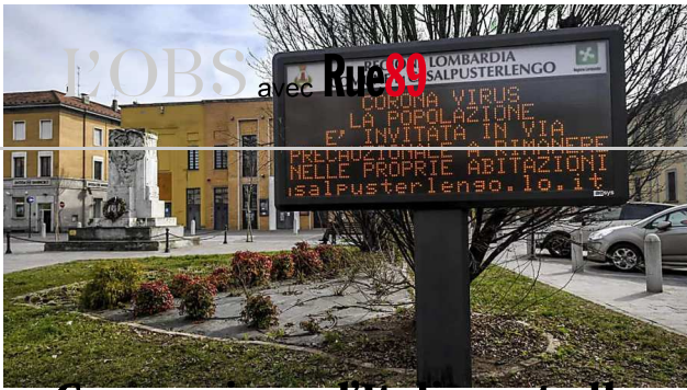
Coronavirus : l'Italie va-t-elle devenir «le Wuhan de l'Europe» ?