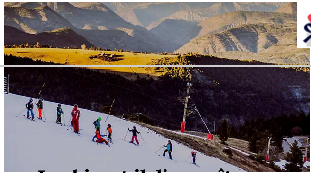
Le ski va-t-il disparaître en France ?